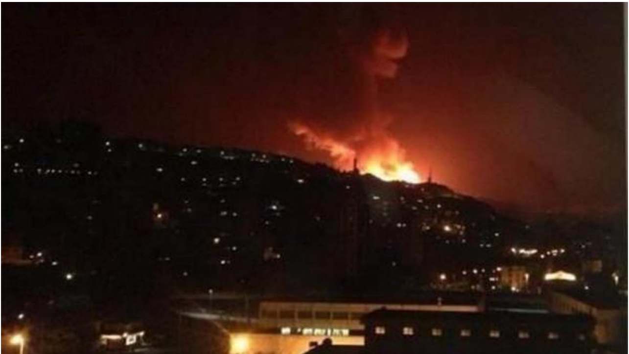
8日，以色列发射导弹袭击叙利亚首都近郊军事基地

今日俄罗斯通讯社报道称，11日“伊斯兰国”武装分子向台德穆尔发起攻击，驻守在市中心的叙政府军开始撤退。《使节报》记者哈勒比认为，极端势力是利用叙政府军集中火力收复阿勒颇之际乘机搅局。