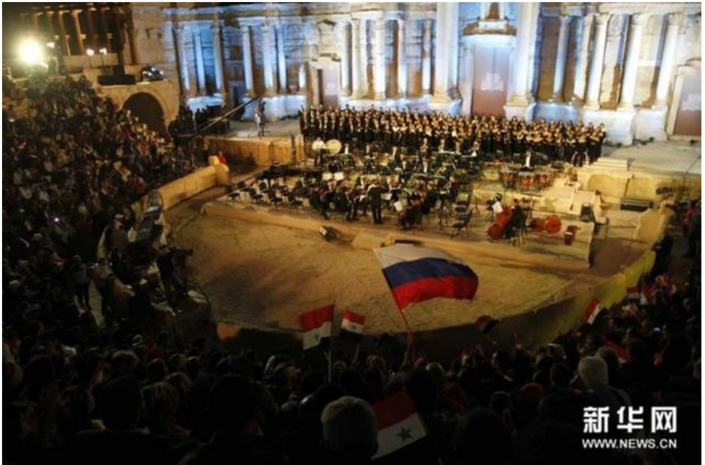
5月，叙利亚与俄罗斯在巴尔米拉举行大型音乐会

据央视新闻，有叙利亚分析人士称，“伊斯兰国”再次攻打巴尔米拉可能是为了扩大周旋范围。