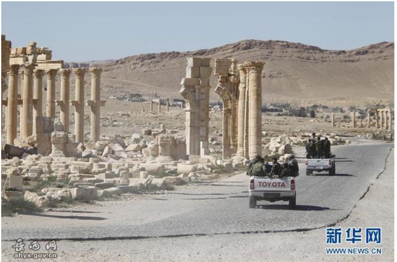
资料图：此前叙利亚政府军在巴尔米拉巡逻

此外，尽管叙利亚政府军集中兵力收复阿勒颇，战事却仍显焦灼；与此同时，有迹象表明极端武装开始转战政府军势力薄弱地区。